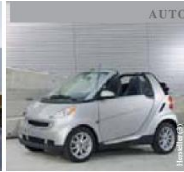
Klein, aber oho: Hochfeste Stähle geben z. B. dem Fiat 500, dem VW Polo und dem smart fortwo hohe Sicherheit.